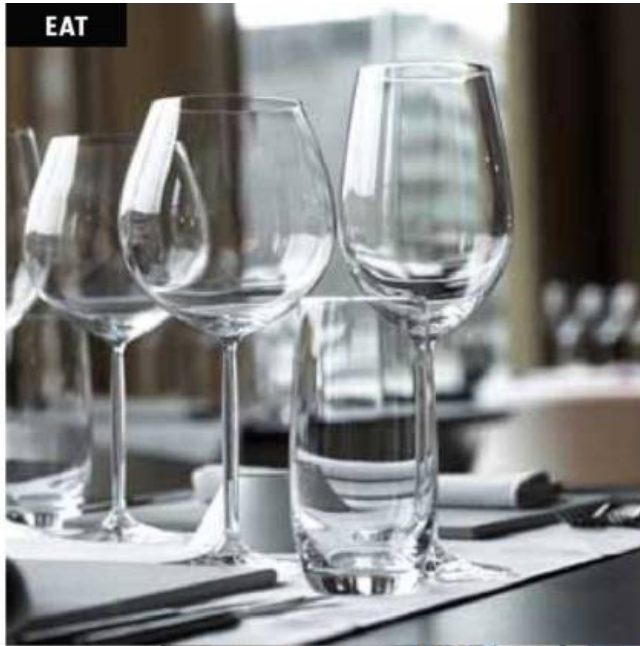
Productie: LIS KEYMEIJER - Beeld: LADONN.