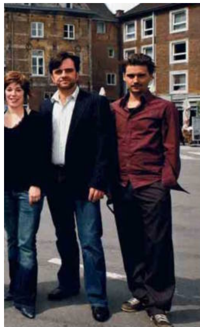
De cast van 'Dag & nacht - Hotel Eburon'.